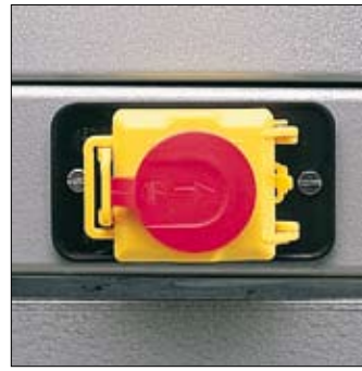
Voorzien van schakelaar met nulspanningsbeveiliging en noodstop