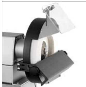
De stalen slijptafel is instelbaar van 90-45°