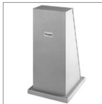
Kolom universeel K 9000HD dikwandig plaatstaal, 4 mm