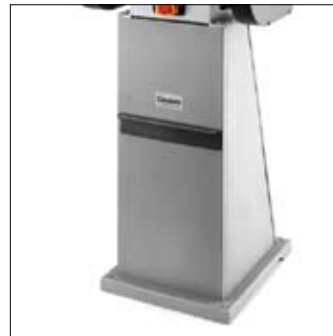
Uitermate geschikt voor montage op kolom AK 9000HD met geïntegreerde stofafzuiging