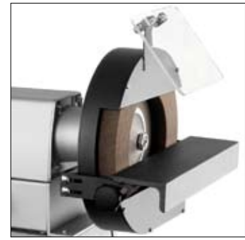
Komslijpschijf voor het verkrijgen van een scherpe hoek of radius