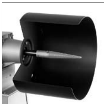
Conische polijstdoorn voor de rechterzijde