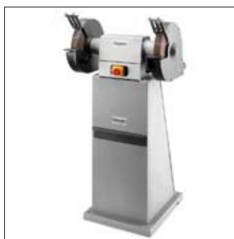
Uitermate geschikt voor montage op kolom AK 9000HD met geïntegreerde stofafzuiging