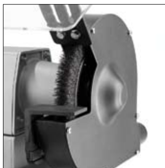
Montage van staaldraadborstel binnen de kap ter vervanging van een slijpschijf