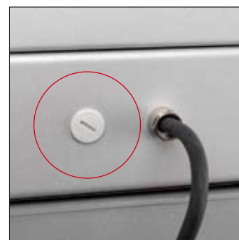
De achterzijde van de machinevoet is standaard voorzien van een tweede aansluitpunt voor montage op kolom AK 9000HD