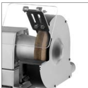
Gietijzeren slijpsteen Hoog gesloten beschermkap biedt verhoogde veiligheid