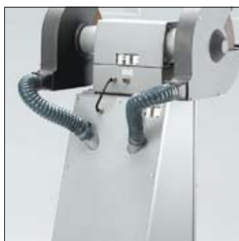
Aansluiting ten behoeve van stofafzuiging aan beide zijden, ø 50 mm