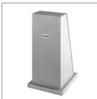
Kolom universeel K 9000HD dikwandig plaatstaal, 4 mm