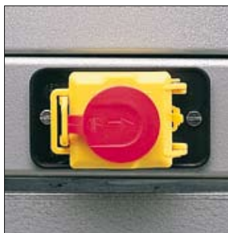
Voorzien van schakelaar met nulspanningsbeveiliging en noodstop