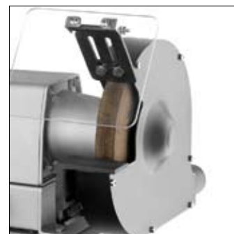
Goede bereikbaarheid van slijpschijven