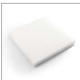
Filter AK 8000 200 x 200 mm art. 900724