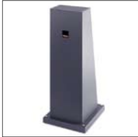
Kolom K 8000 art. 007183