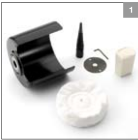
Polijstset ø 150 mm rechts art. 900245