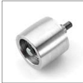
Aluminium keerrrol BSS 8200 art. 900592