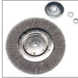
Staaldraadborstel ø 200 x 22 x 15 mm met klemplaat en afstandsbussen art. 900416