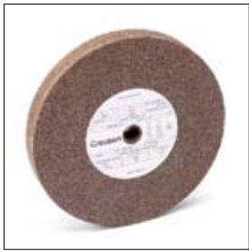
Slijpschijf normaalkorund ø 200 x 25 x 15 mm, korrel 36 art. 700172