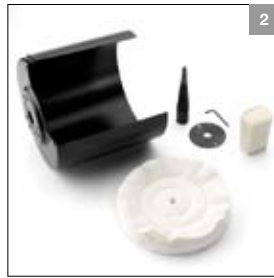
Polijstset ø 200 mm rechts art. 900250