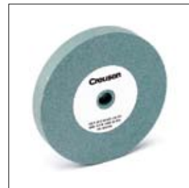
Slijpschijf silicium carbide ø 150 x 20 x 15 mm, korrel 120 voor hardmetaal art. 700359