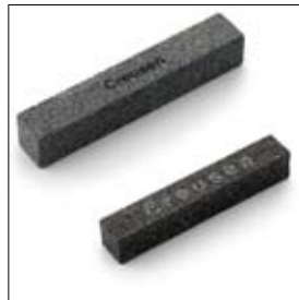
Handdresser, 150 x 25 x 15 mm art. 900284 125 x 25 x 15 mm art. 900251