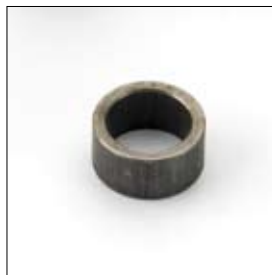
Afstandsbus 20/15 x 10 mm voor DS 8150T/TS art. 280148