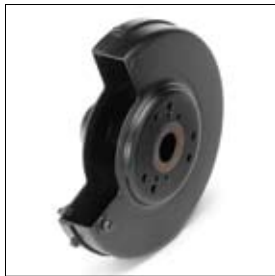
Beschermkap met deksel DS 8200T links art. 1330054