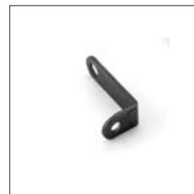
Oogbeschermglasbeugel per stuk (voormalig model) art. 200310