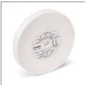
Slijpschijf edelkorund ø 150 x 20 x 15 mm, korrel 100 art. 700392