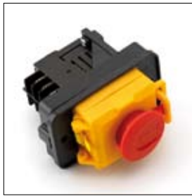
Schakelaar met nulsp. bev. en noodstop tbv 1 en 3 fasen machines art. 449042