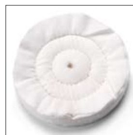
Polijtschijf molton ø 200 x 20 x 10 mm art. 700821