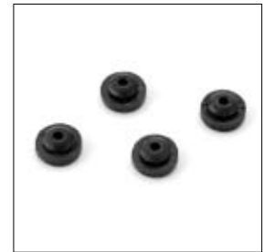
Insteekvoet per 4 stuks art. 560175