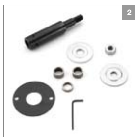
Asverlenging M12 rechts DS 8150T afstand tussen klemplaten 23 mm art. 900394