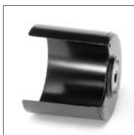
Polijstkap ø 150 mm universeel per stuk art. 200574