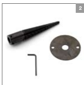
Conische doorn rechts art. 900163