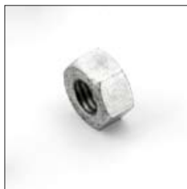
Zeskantmoer M12 rechts art. 668437