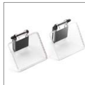
Oogbeschermglazen met vonkenvangers DS 8200T per twee stuks art. 900922