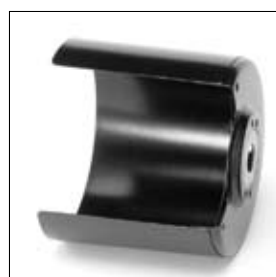
Polijstkap ø 200 mm universeel per stuk art. 200563