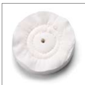
Polijtschijf linnen ø 150 x 20 x 15 mm art. 700513