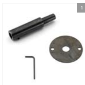
Asverlenging met morse- konus MK3 geschikt voor linker- en rechterzijde art. 900438