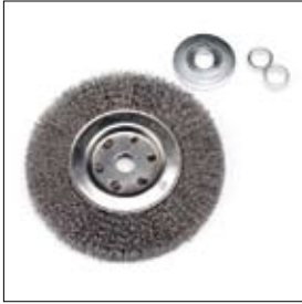
Staaldraadborstel ø 150 x 18 x 15 mm met klemplaat en afstandsbussen art. 900449