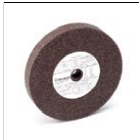
Slijpschijf normaalkorund ø 150 x 20 x 15 mm, korrel 36, art. 700117