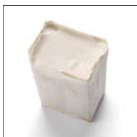
Polijtpasta blokje universeel toepasbaar art. 900240