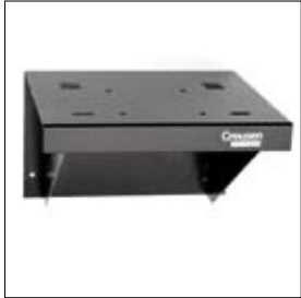
Wandconsole pro-support 270 x 220 x 180 mm art. 900317