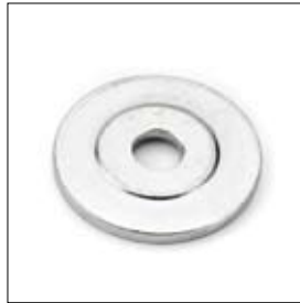
Klemplaat DS 8150T 50/12,1 x 4 mm art. 200409