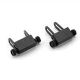
Slijpsteen per twee stuks DS 8150TS art. 1330087