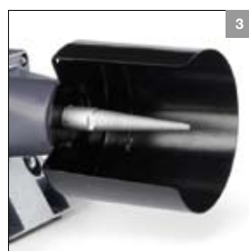
Voorzien van conische polijstdoorn in combinatie met polijstkap ø 150 mm of ø 200 mm