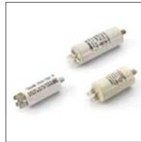
Condensatoren 5uf DS 8150T/TS art. 460031 8uf DS 8200T art. 460053 12uf BSS 8200 art. 460119