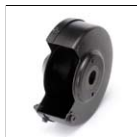
Beschermkap met deksel DS 8150TS links art. 1330032