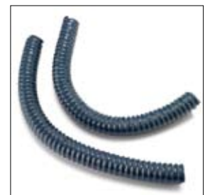
PVC slang voor kolom AK 8000 per stuk art. 251856