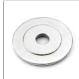
Klemplaat DS 8200T 70/15,1 x 6 mm art. 200442