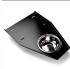
Gereedschapsplateau met waterbak art. 370128