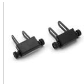
Slijpsteen per twee stuks DS 8200T art. 1330076