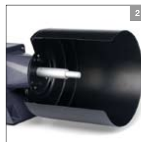
Asverlenging met morse- konus MK3 in combinatie met polijstkap ø 150 mm of ø 200 mm