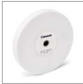
Slijpschijf edelkorund ø 200 x 25 x 15 mm, korrel 60, wit art. 700216