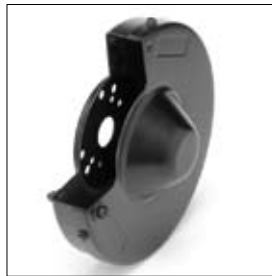
Beschermkap met deksel DS 8200T rechts art. 1330065