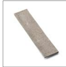
Grafietstrip BSS 8200 55 mm links 230 mm art. 571417