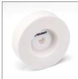
Komslijpschijf edelkorund ø 150 x 40 x 15 mm, korrel 60 art. 700348