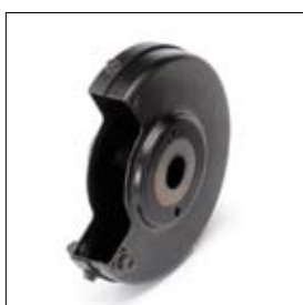
Beschermkap met deksel DS 8150T links art. 1330010