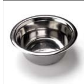
Waterbak tbv gereedschaps- plateau art. 900889