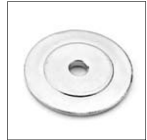
Klemplaat DS 8200T 70/12,1 x 6 mm art. 200453