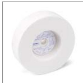
Komslijpschijf edelkorund ø 150 x 40 x 15 mm, korrel 100 art. 700139