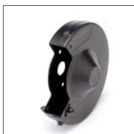
Beschermkap met deksel DS 8150T en TS rechts art. 1330021