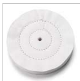
Polijtschijf linnen ø 200 x 20 x 10 mm art. 700810