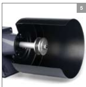
Asverlenging leverbaar in combinatie met polijstkap ø 150 mm of ø 200 mm