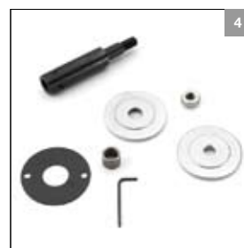
Asverlenging M12 rechts DS 8200T afstand tussen klemplaten 20 mm art. 900416