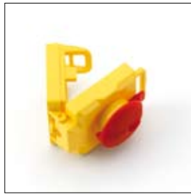
Noodstop (deksel) art. 251889