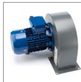
Afzuigmotor N252 voor kolom AK 8000 art. 780043