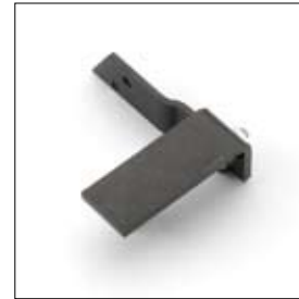
Slijpsteen links met moer BSS 8200 art. 1350020