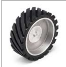
Contactwiel BSS 8200 ø 150 x 50 x 15 mm art. 900548