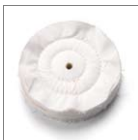
Polijtschijf molton ø 150 x 20 x 15 mm art. 700524