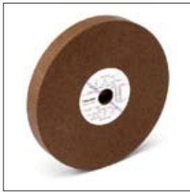
Slijpschijf normaalkorund ø 200 x 25 x 15 mm, korrel 80 art. 700183