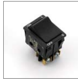
Schakelaar 1-fase zwart (voormalig model) art. 440011