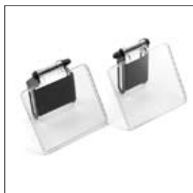
Oogbeschermglazen met vonkenvangers DS 8150TS per twee stuks art. 900911