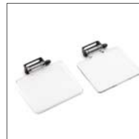
Oogbeschermglazen universeel polycarbonaat per twee stuks art. 900009