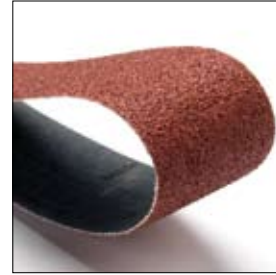
Slijpband 1000 x 50 mm, korrel 40, BSS 8200 art. 700909