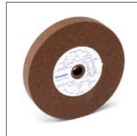
Slijpschijf normaalkorund ø 150 x 20 x 15 mm, korrel 80 art. 700128