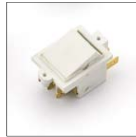
Schakelaar 1-fase wit (voormalig model) art. 440308