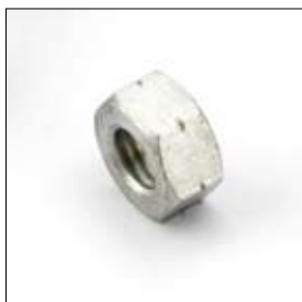
Zeskantmoer M12 links art. 668558