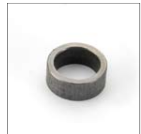
Afstandsbus 20/15 x 8 mm voor toebehoren art. 280104