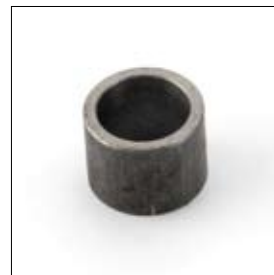
Afstandsbus 20/15 x 15 mm voor DS8200 art. 280115