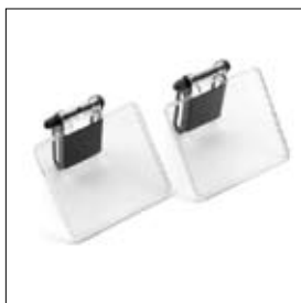
Oogbeschermglazen met vonkenvangers DS 8150T per twee stuks art. 900900