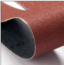
Slijpband 1000 x 50 mm, korrel 80, BSS 8200 art. 700931