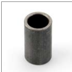
Afstandsbus 20/15 x 34 mm voor BSS 8200 art. 280511