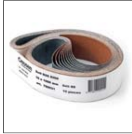
Slijpbanden, per tien stuks verpakt